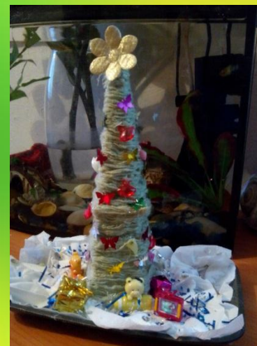
Акция: «Ёлочка живи»