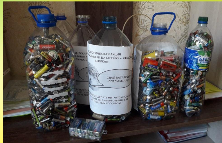
Акция «Сдай батарейку-спаси Ёжика»