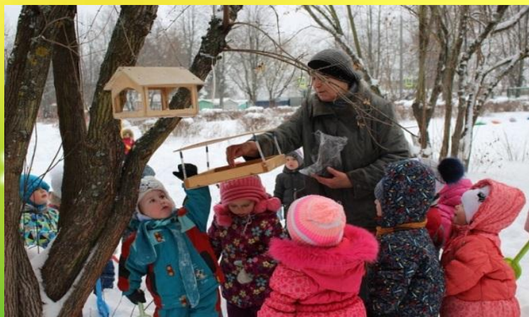
Акция: «Птичья столовая»