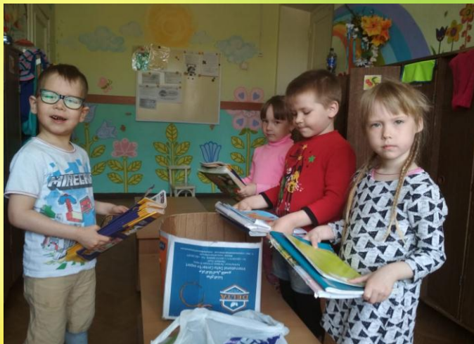
Акция «Собираем макулатуру – бережем деревья!»

Мы без дела не сидим, акции всегда блюдим! Чтобы в красоте нам жить и немножечко творить!