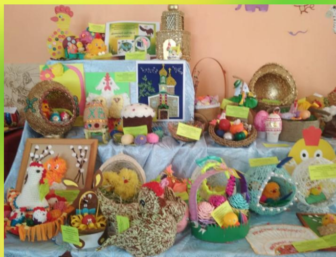
Городской конкурс: «Пасхальная»